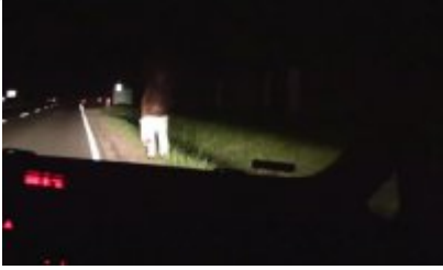
niechroniony uczestnik ruchu drogowego