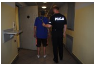
sprawdzenie zatrzymanego przed osadzeniem