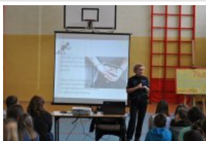
spotkanie z gimnazjalistami