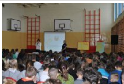
prelekcja dla gimnazjalistów

pozwalających skuteczniej walczyć z przestępcami w sieci.